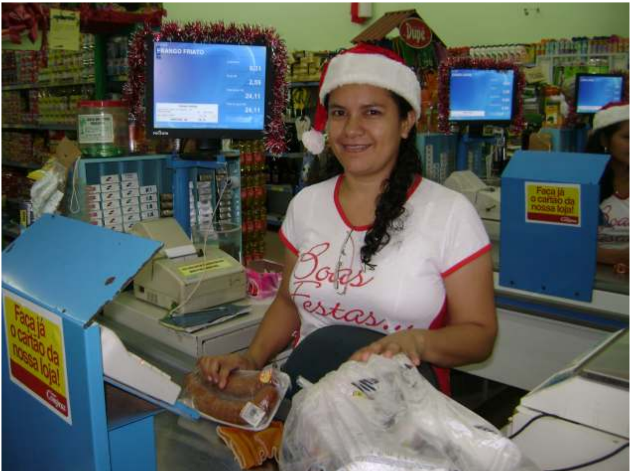
PAF (Programa Aplicativo Fiscal) Small Commerce em uso em um mercado em Porto Velho - RO

Agregando diversos controles, como a verificação a cada documento emitido, do valor de Venda Bruta do ECF, o PAF também deve assegurar que o relógio do terminal ponto de venda não esteja divergente em relação ao do ECF em até 15 minutos. De acordo com a legislação da unidade federada, antes de receber a autorização de uso nos estabelecimentos comerciais, o PAF deve ser homologado ou registrado na Secretaria da Fazenda. Uma das suas obrigatoriedades é a geração de arquivos em formato texto para envio ao fisco (Sintegra, Ato Cotepe 17/04). Estas exigências estão descritas na legislação do ECF, através do Convênio ICMS 85/01.